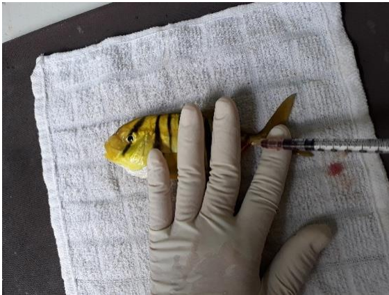
Hình 1. Mô tả cách thu máu cá